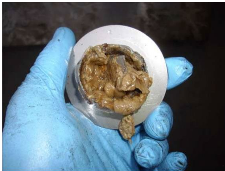
Foto: Voorbeeld micro-organismen in een filtersysteem.