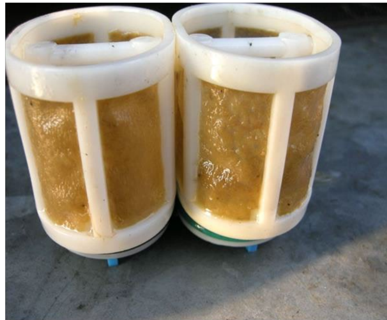
Foto: Voorbeeld verontreiniging filter met micro-organismen.

De inspectie-instelling kan ervoor kiezen het monster zelf te meten of dit te laten doen door een geaccrediteerd laboratorium.