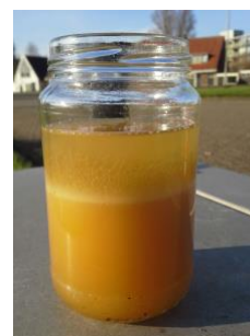
Diesel met microbiologische verontreiniging.

Voor de uitvoering van de test ter plaatse houdt de inspecteur de richtlijnen aan van de leverancier/fabrikant van de cATP-meter. Wanneer de test in een laboratorium wordt uitgevoerd, moet het monster worden behandeld, geconditioneerd en opgeslagen conform de richtlijnen van het laboratorium.